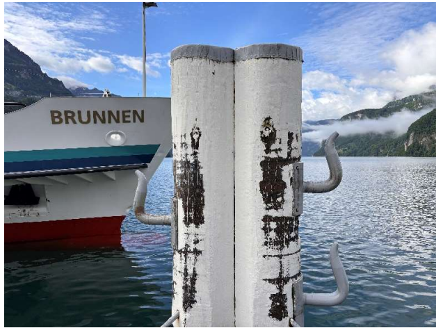
Schiffahrt von Brunnen nach Luzern