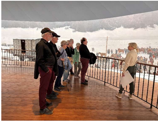
Bourbaki in Luzern