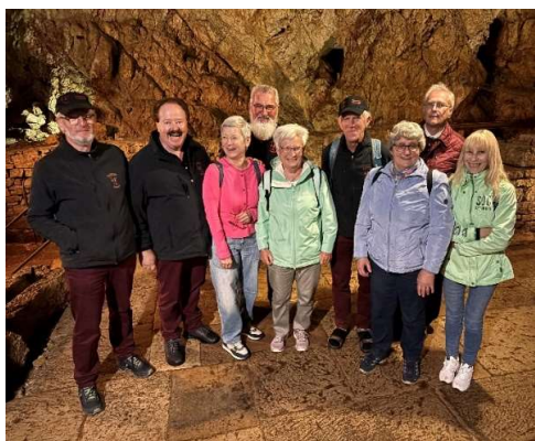
Unterirdische Mühlen Le Locle