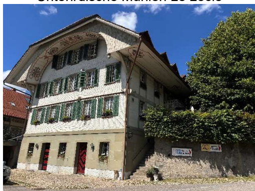
Heimiswil ältester Löwen der Schweiz