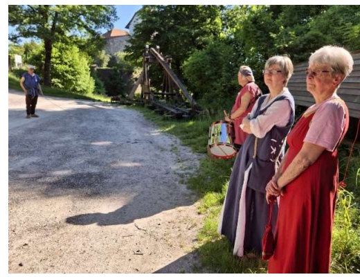
mittelalterliche Wurfmaschine in Laupen