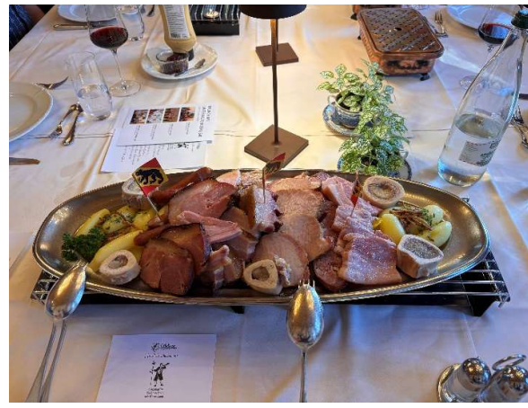
eine Berner – Platte für die Ostschweizer