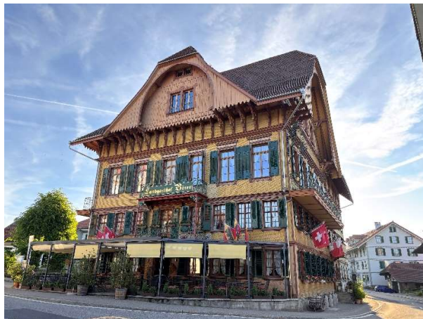
Landgasthof Bären Sumiswald