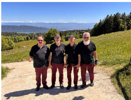
la Vue – des - Alpes