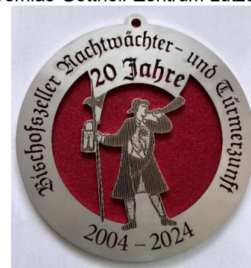
Jubiläums - Plakette